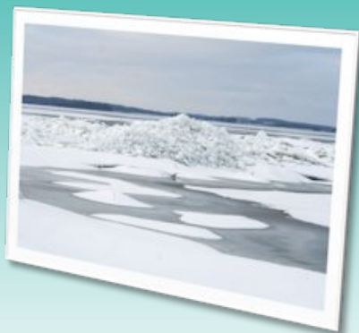
Isvinter 2010 på Nyord

Læs mere om oplevelser på Nyord på side 5.